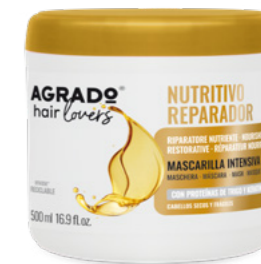
5606 MASCARILLA MÁSCARA 500 ml