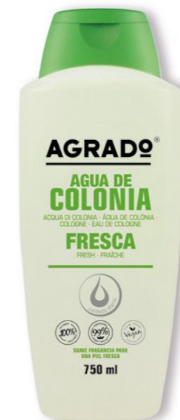
5973 FRESCA 750 ml