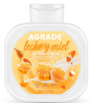
9960 LECHE Y MIEL LEITE E MEL 750 ml