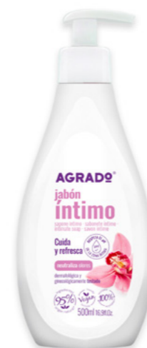
5769 JABÓN ÍNTIMO SABONETE ÍNTIMO 500 ml