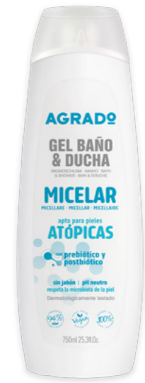
9602 GEL BAHNO MICELAR MICELAR GEL ATOPIC 750 ml