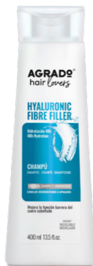
9731 CHAMPÚ SHAMPÔ 400 ml