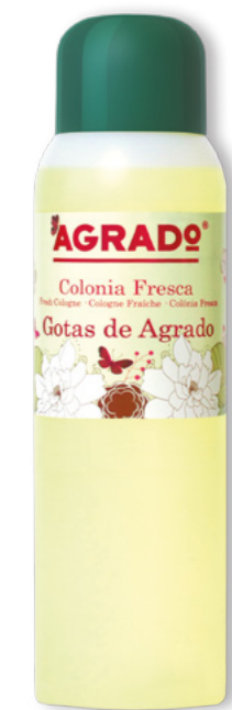
4896 GOTAS DE AGRADO 1000 ml