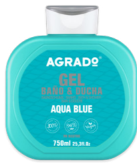
6050 AQUA BLUE 750 ml