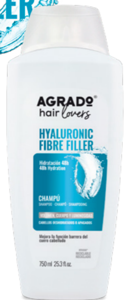
9730 CHAMPÚ SHAMPÔ 750 ml