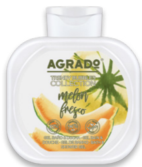
6103 MELÓN FRESCO MELÃO FRESCO 750 ml