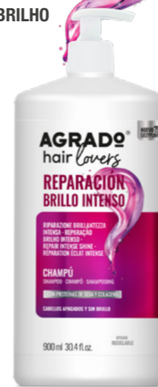
9866 CHAMPÚ SHAMPÔ 900 ml