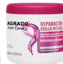
5506 MASCARILLA MÁSCARA 500 ml