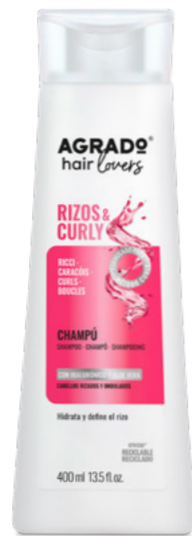
9737 CHAMPÚ SHAMPÔ 400 ml