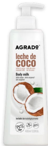
6225 LECHE DE COCO LEITE DE COCO 400 ml