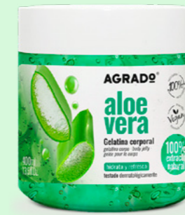
9637 ALOE VERA ALOE 400 ml