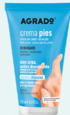
9740 CREMA HIDRATANTE PIES CREME HIDRATANTE PÉS 125 ml