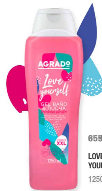
6557 LOVE YOURSELF 1250 ml