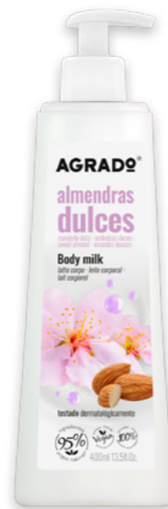
6228 ALMENDRAS DULCES AMÊNDOAS DOCES 400 ml