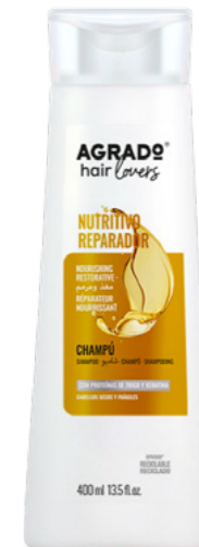
5164 CHAMPÚ SHAMPÔ 400 ml