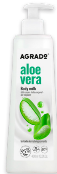
6226 ALOE VERA ALOE 400 ml