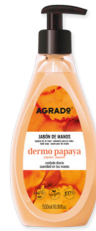
5785 PAPAYE 500 ml