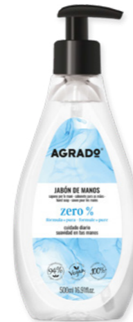
5786 CERO % 500 ml