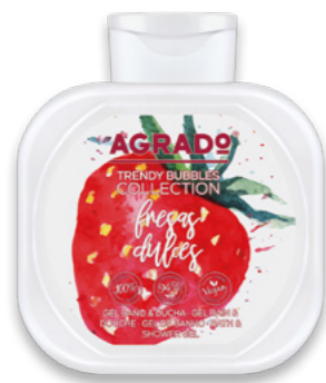
6102 FRESAS DULCES MORANGOS DOCES 750 ml