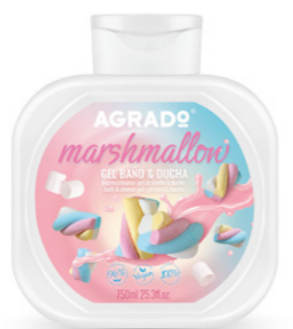
9961 MARSHMALLOW 750 ml