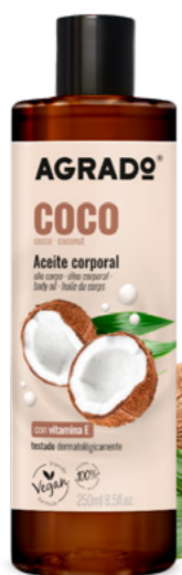
8451 COCO 250 ml