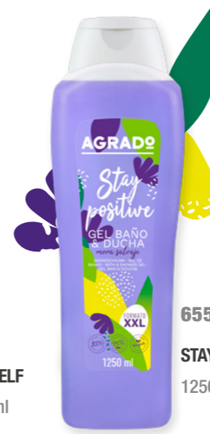
6558 STAY POSITIVE 1250 ml