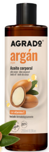
8452 ARGAN 250 ml