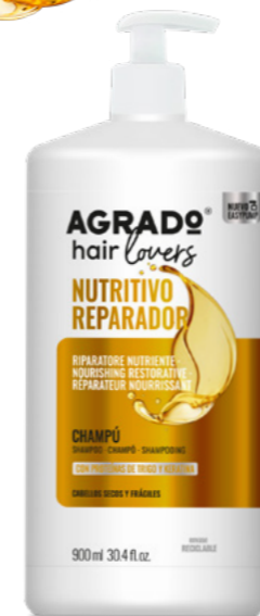
9867 CHAMPÚ SHAMPÔ 900 ml