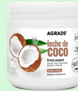
9638 LECHE DE COCO LEITE DE COCO 400 ml