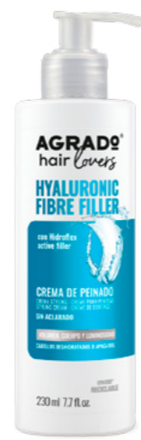
9878 CREMA DE PEINADO CREME DE MODELAÇÃO 230 ml