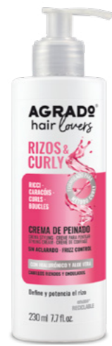
9739 CREMA DE PEINADO CREME DE MODELAÇÃO 230 ml