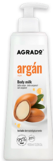
6227 ARGÁN ARGAN 400 ml