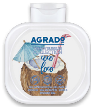
6105 COCO LOCO 750 ml