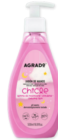
5875 CHICLE CHICLETE 500 ml