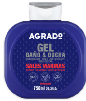
4901 SAIS MARINHAS MARINE SALTS 750 ml