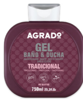
5932 TRADICIONAL 750 ml