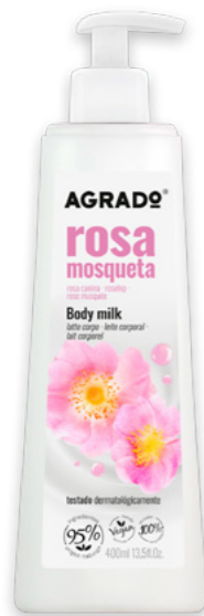
5671 ROSA MOSQUETA 400 ml