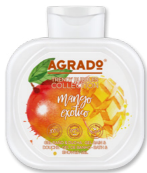
8862 MANGA EXÓTICO EXOTIC MANGO 750 ml