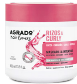
9728 MASCARILLA CAPILAR MÁSCARA 400 ml