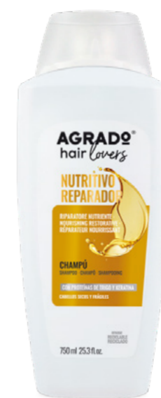
4882 CHAMPÚ SHAMPÔ 750 ml