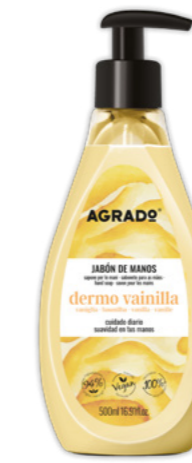
5781 VAINILLA VANILLE 500 ml