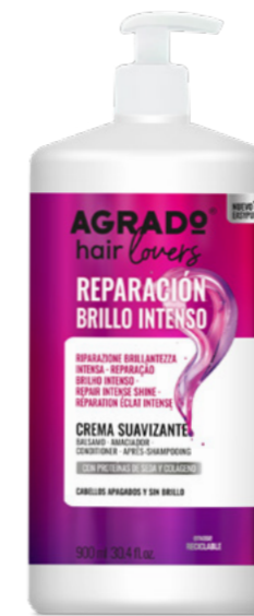
9868 CREMA SUAVIZANTE AMANCIADOR 900 ml