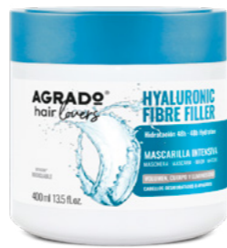
9738 MASCARILLA CAPILAR MÁSCARA 400 ml