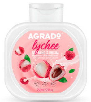
9959 LYCHEE LICHIA 750 ml