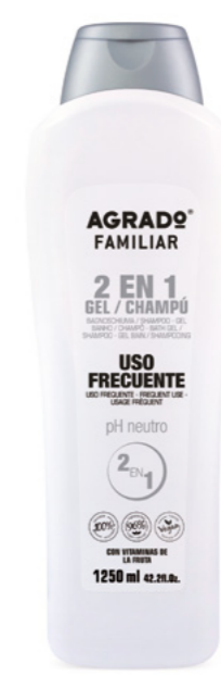
4890 GEL DE BAÑO / CHAMPÚ GEL BANHO / CHAMPÔ 1250 ml