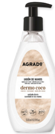
5779 DERMO COCO 500 ml