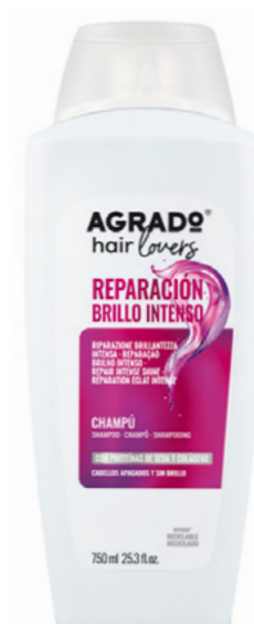
4883 CHAMPÚ SHAMPÔ 750 ml