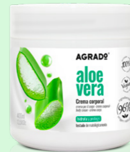
9639 ALOE VERA ALOE 400 ml