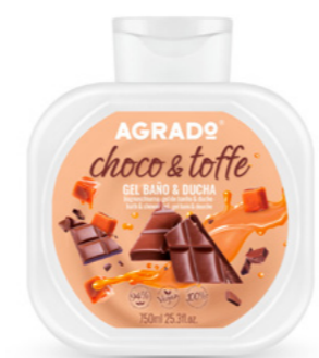
9962 CHOCO TOFFEE 750 ml