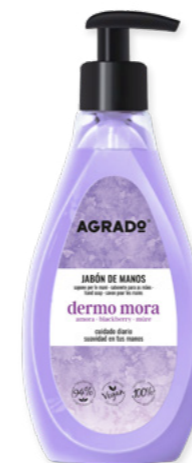
5780 MORA AMORA 500 ml