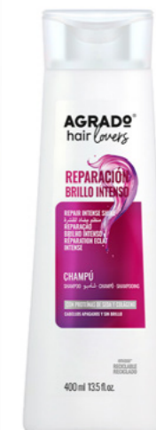
5165 CHAMPÚ SHAMPÔ 400 ml