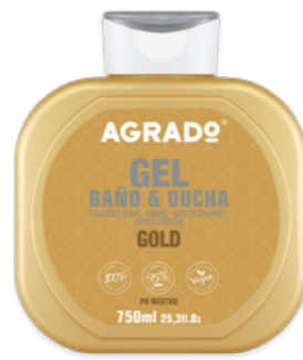
4902 GOLD 750 ml