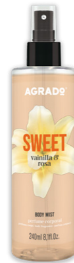
9269 VAINILLA Y ROSA BAUNILHA Y ROSA 250 ml