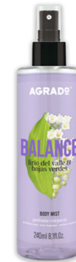
9270 LIRIO DEL VALLE Y HOJAS VERDES LÍRIO DO VALE E FOLHAS VERDES 250 ml