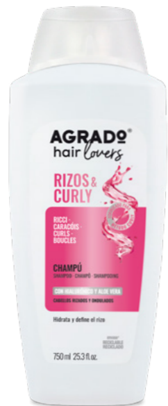
9729 CHAMPÚ SHAMPÔ 750 ml