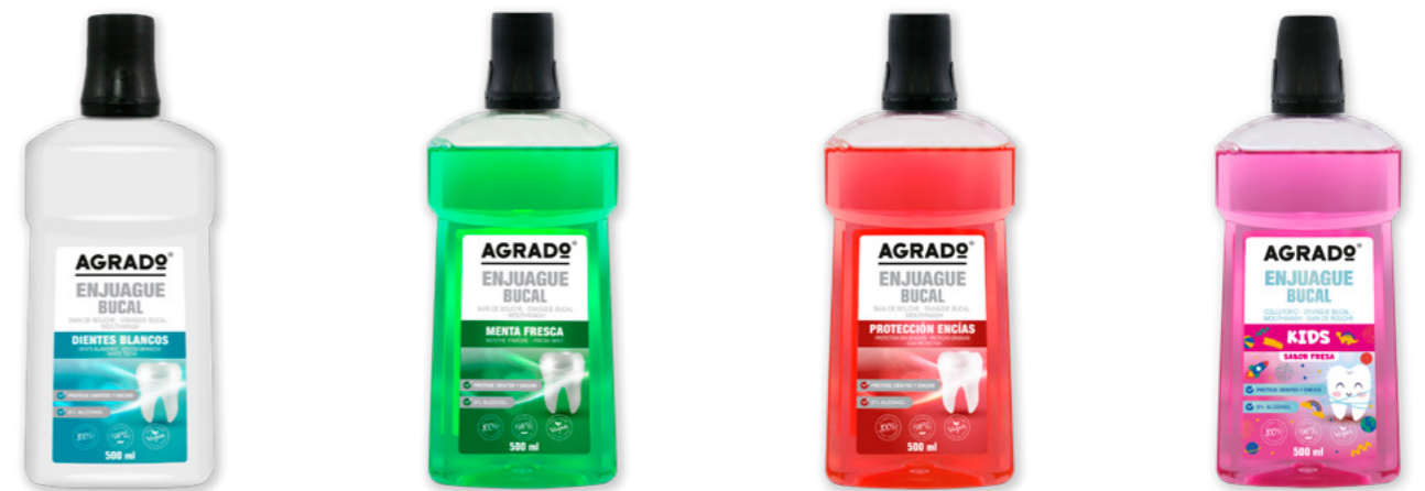
5283 DIENTES BLANCOS DENTES BRANCOS 500 ml 5284 MENTA 500 ml 8815 PROTECCIÓN DE ENCIAS PROTEÇÃO GENGIVAS 500 ml 9268 KIDS 500 ml