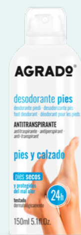
9741 DESODORANTE ANTITRANSPIRANTE PIES DESODORIZANTE ANTITRANSPIRANTE PÉS 150 ml