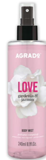
9271 GARDENIA Y JAZMÍN GARDÊNIA E JASMIM 250 ml