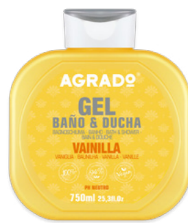
5286 BAUNILHA VANILLA 750 ml